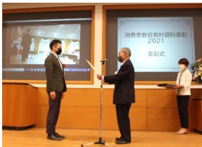
消費者教育教材資料表彰授賞式の様子

日立ソリューションズは、長年にわたるセキュリティ事業で培ったノウハウを元に、今後もセキュリティ分野の次世代人財育成に貢献していきます。