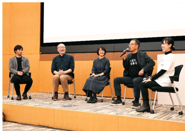
<パネルディスカッションの様子>