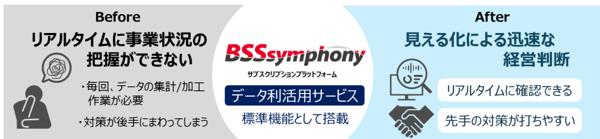
図1 「データ活用サービス」が寄与するサブスクリプションビジネスの事業改善

日立ソリューションズは今後も、所有から利用へとビジネスの転換を図る企業に向けて、サブスクリプションビジネスの立ち上げから運用までを支援し、企業データドリブン経営を推進します。