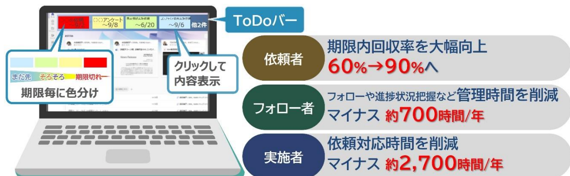
図：グループタスク リマインダーサービスを適用した依頼管理イメージ