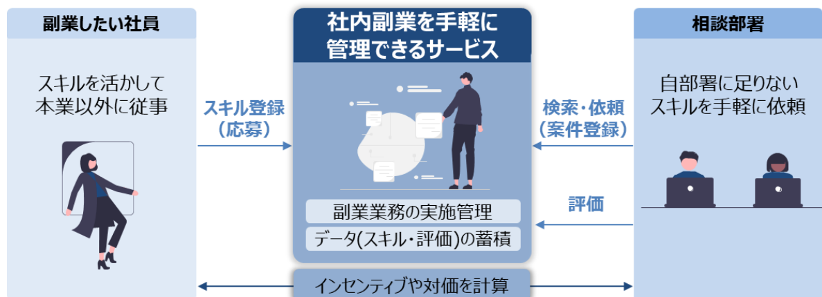
図：社内副業を手軽に管理できるサービスで実施する社内検証の概要

日立ソリューションズでは、持続可能な社会への貢献と、持続可能な経営に向けた変革活動であるSXに、2022年度から取り組んでいます。持続可能な経営には、従業員体験（EX）の向上が不可欠だと捉え、これまでに、入社3年目の全社員が自発的に部署異動に挑戦できる「若年層ジョブマッチング制度」やエルダー社員のスキルを有効に活用するジョブマッチング制度、そして、シリコンバレーで起業に挑戦できる「スタートアップ創出制度」など、社員が自律的にキャリアを形成できる環境を整えています。本検証もEX向上に向けた取り組みとして行うと同時に、そのノウハウをサービス化し、幅広い企業への提供をめざしています。