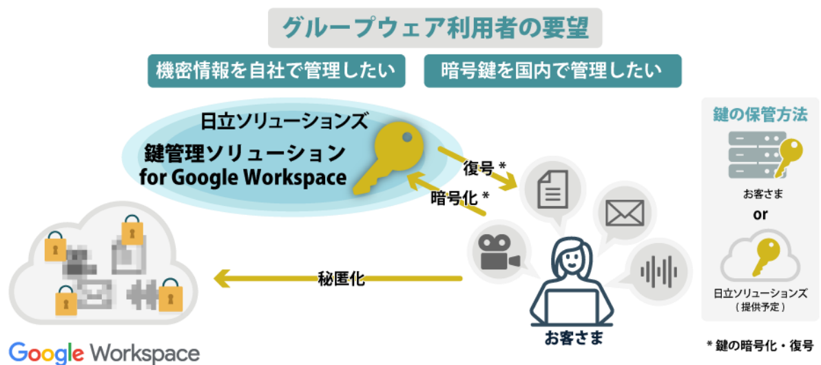
図：鍵管理ソリューション for Google Workspace のイメージ図

*1 ファイルの内容やメール、音声・ビデオデータ等をクライアント側で暗号・復号し、クラウドサービスには暗号化したデータを送る技術