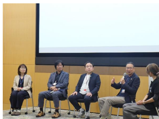
<パネルディスカッションの様子>