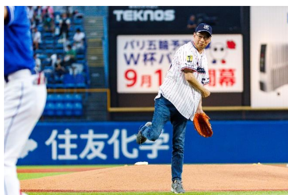
山本社長による始球式

イベント当日は、東京ヤクルトスワローズとコラボレーションした限定うちわを観客の皆さまに配布し、明治神宮野球場でともに応援しました。また、Twitter でイベント連動型のキャンペーンを実施し、「挑戦する人を応援する #日立ソリューションズ」「勝利をめざす #swallows」のハッシュタグで、オンラインからもともに応援しました。