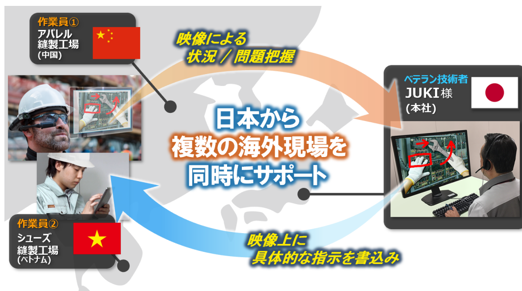
図: JUKIのシステム利用イメージ