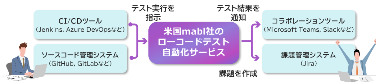
図2 ツール連携による開発パイプラインのイメージ