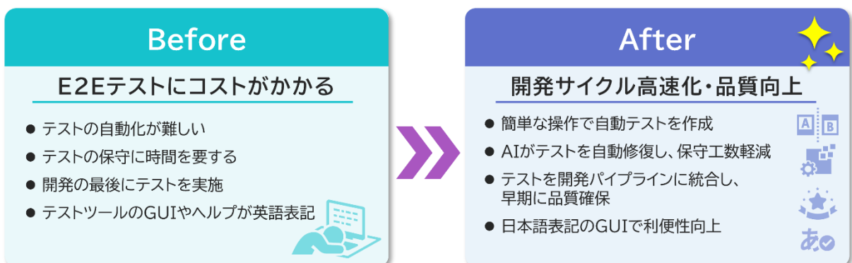
図1 本サービス適用による効果

*1 ユーザエクスペリエンスの検証を目的とするテストであり、アプリケーションが期待どおりに動作するか、データフローが適切に機能するかどうかを、システム全体を通して確認するテストのこと