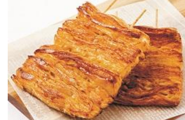
フォトジェニックうなぎ

クロワッサン生地と蒲焼タレは意外にも好相性。〈ポール・ボキューズ〉蒲焼き仕立てのクロワッサン259円