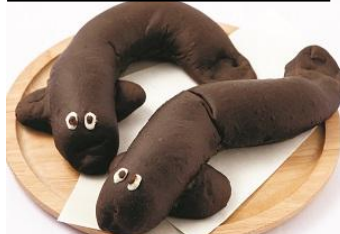
フォトジェニックうなぎ

ブラックココアが香るしっとり生地の中にチョコカスタード。〈カラ・アウレリア〉うなぎパン324円