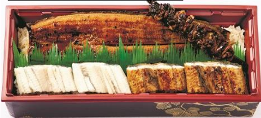
うなぎまるごと食べ比べ

宮崎産うなぎ1尾分をはじめ、白焼きや蒲焼き、国産肝串を盛り込みました。〈中島水産〉ウナギまるごと一本重4,580円 ※販売期間 7/18~20