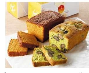
〈パティシエ イナムラショウゾウ〉 抹茶黒豆ケーキ、キャラメルアーモンドカステラ 各1,300円 ※6/9(金)のみ、各15点限定