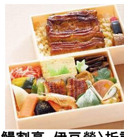
〈鰻割烹 伊豆榮〉折詰四季弁当(うなぎ入り) 1,620円、うなぎ重2,430円※各日12時~販売