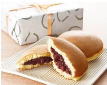
〈うさぎや〉どらやき 5個入 1,025円 ※6/14(水)除く各日11時~販売、6/9、10、11は15時~も販売