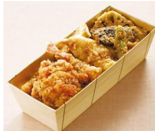
〈てんぷら 天庄〉 江戸前天丼 2,214円 ※6/12(月)除く各日12時~販売