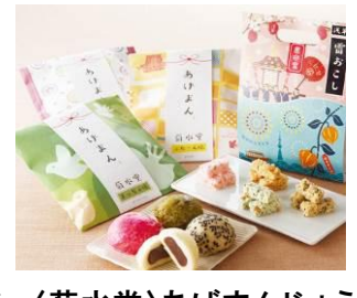
〈菊水堂〉あげまんじゅうよりどり3袋 1,000円