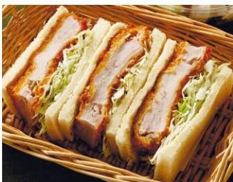
〈肉のさいとう初音〉 ヒレカツサンド 750円