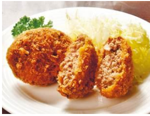
大分県豊後大野市 〈道の駅あさじ〉 豊後牛メンチカツ1個300円