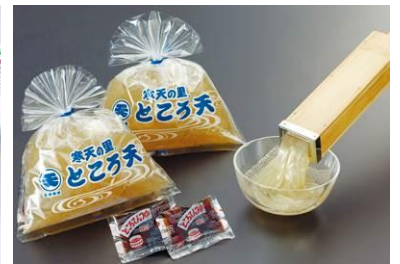
長野県諏訪市 〈諏訪市推せんみやげ品〉 まるてんのところ天 400g 300円