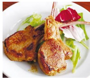
〈下町バルながおか屋〉 ラムチョップ