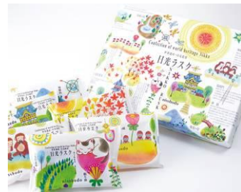
栃木県日光市 〈日昇堂〉 日光ラスク 40g×6 1,320円