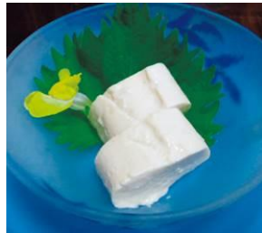
宮城県大崎市 〈粟野商店〉 湯葉重ね豆腐 110g 486円