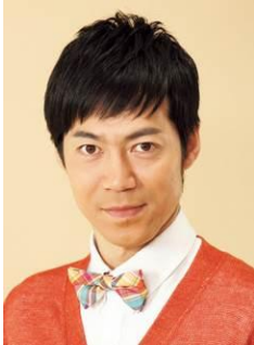
東貴博 トークショー ■6月13日(火) 14時～