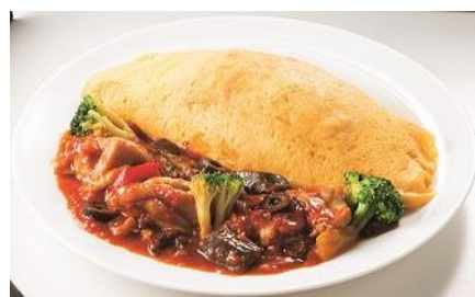
〈洋食や 三代目 たいめいけん〉 チキンのプロバンス風オムライス 1,250円