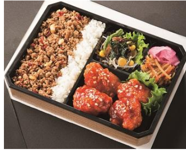
〈韓カルビ 大雲〉 韓国鶏どり弁当880円