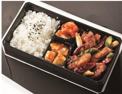
〈銀座アスター〉 火の鳥弁当972円