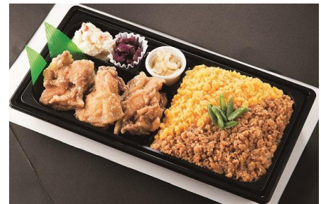
〈おかず本舗 佃浅〉 葱塩かぼすだれの唐揚げと鶏そぼろ 弁当1,188円