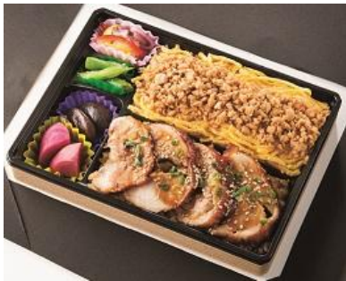
〈あびす Daikoku〉 鶏2(とりとり)のつけ膳 1,300円

2017年の干支は丁酉(ひのととり)。酉はニワトリのことを指し、ニワトリは縁起のいい動物として有名です。そんな酉を今年は「とりこむ」！体の中に運氣を「とりこみ」、新年からいいスタートが切れるよう、そんな“福”を呼び込んでくれるようなチキンを使った弁当「チキ弁」をご紹介します！