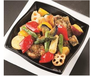
〈ポール・ボキューズ〉 3種のローストチキンと彩り野菜 DON 弁当 1,100円