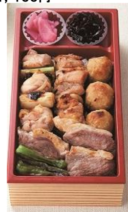
〈両国 鳥幸〉 いわいどり弁当 デラックス 1,080円