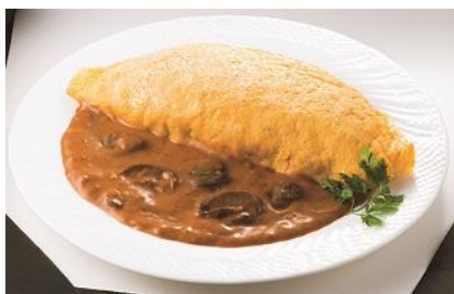
〈西洋銀座〉 シェフ手作りの オムライス・きのこソース 918円