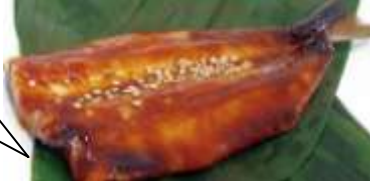
〈魚道楽 富惣〉いわし蒲焼 270円 ※各日限定30個