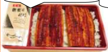
〈にぎり寿司 彦丸〉 うなぎ重(特上)2,480円