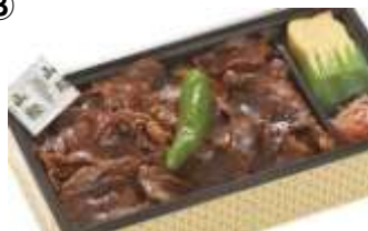
〈まい泉〉ぶた蒲重 799円