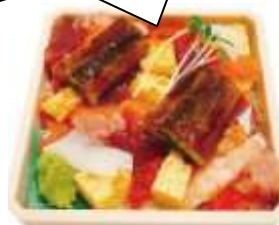
〈知床鮨〉 うなぎ入りバラちらし 980円