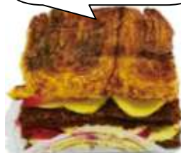
〈アドリア洋菓子店〉 蒲焼風イチゴミルフィーユ 420円 ※限定30個、7/30(土)限り