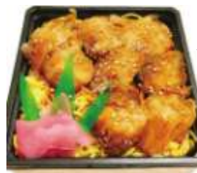
〈新宿 秀吉〉 太刀魚の蒲焼重 700円