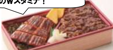
〈柿安ダイニング〉 黒毛和牛牛めし&国産うなぎ重 1,580円