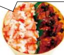
〈札幌かに家〉 鰻とかにのわっぱ寿司 1,350円 ※各日限定20