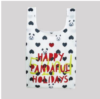
「バナーエコバッグ」

松坂屋上野店は、11/27(水)～12/25(水)、使用済みの館内装飾バナー(※1)をエコバッグに作り変えた「アップサイクル(※2)バナーエコバッグ」を抽選でプレゼントする企画を実施いたします。