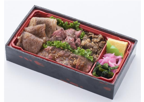
米沢牛をふんだんに盛り込んだ当店自慢のお弁当です。中にはステーキ(塩味とガーリックオニオン味)、焼肉、すき焼を入れてあります。〈味の梅ばち〉米沢牛盛り込み弁当3,240円※各日予定数10