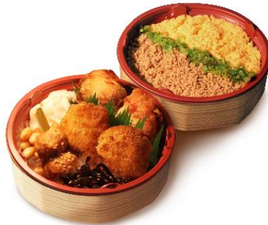
ひと口チキンカツと塩と醤油の唐揚げ入り。自家製の鶏そぼろご飯とともにくからっ鳥)鶏三昧弁当1,885円