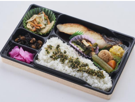
高級魚の銀だらを西京漬にして、惣菜を盛り込み、見た目良く仕上げています。〈魚道楽〉銀だら西京焼弁当1,728円※各日予定数10