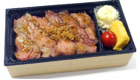
仲卸ならではの厳選国産牛を美味しいソースでステーキに。柔らかな国産牛の味わいを存分にご堪能下さい! 〈千駄木腰塚〉シャリアピンステーキ弁当1,760円※各日予定数10