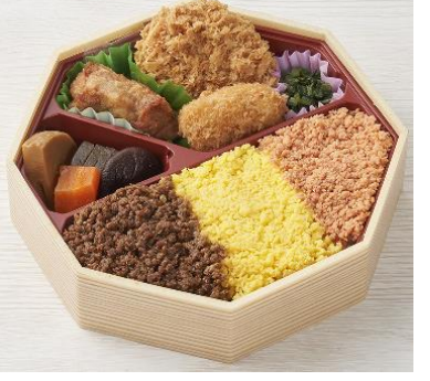
揚げ物はヒレかつとエビクリームコロッケ。人気おかずの鶏からあげも入った三種の御飯(黒豚そぼろ、玉子そぼろ、鮭フレーク)が楽しめるいろいろ豊かなお弁当です。〈まい泉〉いろいろ弁当1,058円※各日予定数15