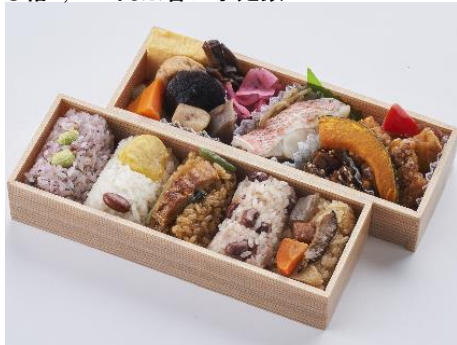
肉、魚、野菜がすべて入っており、おこわも5種類楽しめる、当店人気 No.1 のお弁当です。〈おこわ米八〉米八二段重ね〈梅〉1,379円※各日予定数20