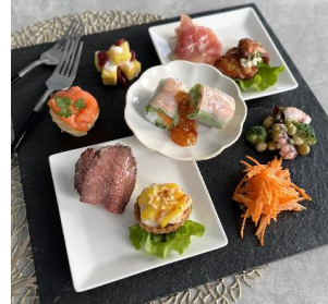
海老の生春巻きにローストビーフ、スモークサーモントラウト、生ハムなど、9種のごちそうを盛り込んだ、彩り豊かな豪華盛り合わせです。〈イーション〉9種彩るバラエティーセット1,290円※各日予定数30