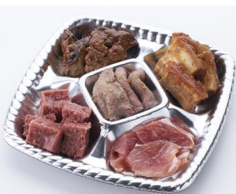
しっとりやわらかい鶏レバーに肩ロースの生ハム等、5アイテムをチョイスしたオードブルです。〈ハム工房〉ハム工房オードブル1,890円※8/10~8/18各日予定数6