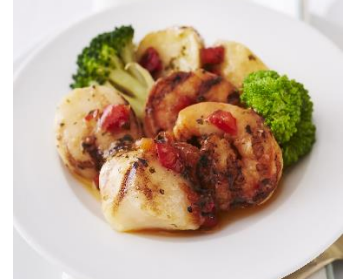
魚介のグリルを香草オイルで仕上げたごちそうメニュー。〈RF1〉北海道産帆立と海老のハーブグリルとローストポテト(100gあたり)949円※各日予定数5kg

【取材に関するお問い合わせ先】大丸松坂屋百貨店 大丸東京店 首都圏 PR 広報(榎本・宮川)