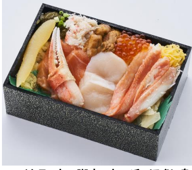
ウニ、イクラ、カニ脚肉、カニ爪、ほぐし身、サーモン、ホタテ、数の子、ガゴメなど、北の華がたっぷり入ったちらし寿司〈知床鮭〉北の大漁ちらし2,376円※各日予定数10