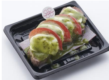
フレッシュモッツアレラの白とトマトの赤とジェノベーゼソースの緑でカプレーゼ風に仕上げました。〈ポール・ポキューズ デリ〉希少部位トモサンカクの贅沢しっとりローストビーフステーキカット~カプレーゼ仕立て~999円