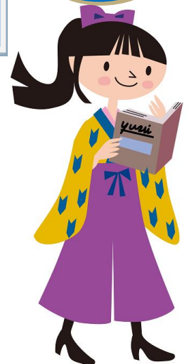
ぴったリーちゃん