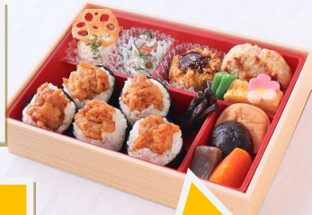
〈地雷也〉白河弁当(土日限定、各日10)