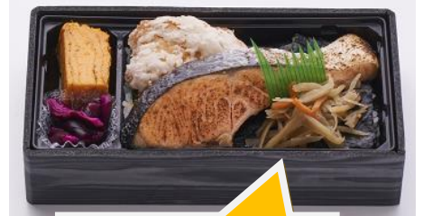
〈佃浅〉大森下町海苔弁当(鮭)(各日15)