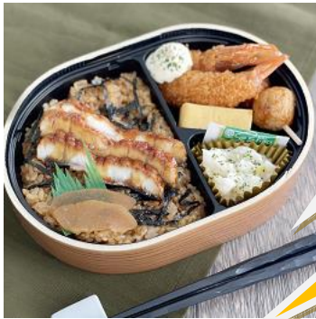
〈イーション〉愛知県三河一色産鰻のまぶし弁当(各日50)