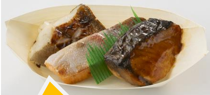
〈魚道楽〉焼魚セット(各日10)