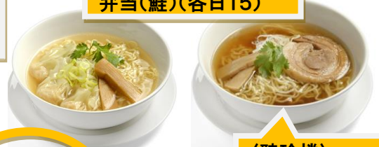
〈聘珍楼〉醤油ラーメン2食・海老塩ラーメン2食セット(各日5)