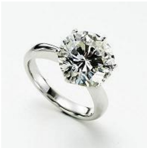
最低落札価格2015万円福袋(1点) 5カラットのダイヤモンドリング

落札された商品は松坂屋上野店からの発送になりますので、ご贈答用の包装ができ、すべて新品であることなど、ネットオークションでありながら、「百貨店クオリティ」であることが大きな特徴です。販売開始から約20点落札いただき、現在約50点を販売しています。