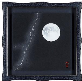
岩谷晃太 「月と稲妻」 4号 S 385,000円(税込)

漆黒の夜空に浮かぶ月と稲妻、太古から続く大自然の摂理を現代的に表現する岩谷晃太の展覧会。