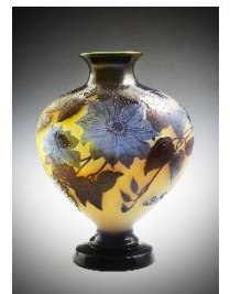
ガレ 「クレマチス文花器」 高さ 37×横 24cm 2,200,000円(税込)

7階アートゾーン 期間:7月12日(水)~18日(火) 10時~18時30分 ※最終日は16時閉場