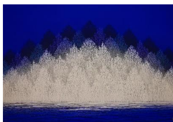
泉東臣「蒼刻」 20号 M 1,100,000円(税)