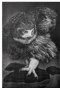
生田宏司 「凜」メゾチント 68.0×45.5cm 242,000円(税込)

卓越した技術力で漆黒の画面に命を吹き込む銅版画家。ふくろうや猫など、情感豊かに表現している。