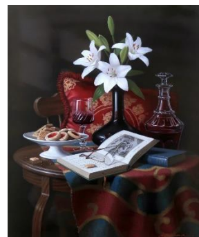
伊熊義和「至福の時間」 20号 770,000円(税込)