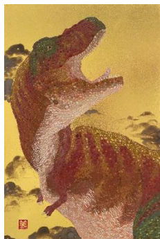
水島篤「共鳴-ティラノサウルス-」 6号 198,000円(税込)