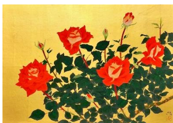
霜鳥忍「朗羅」 20号 1,540,000円(税込)