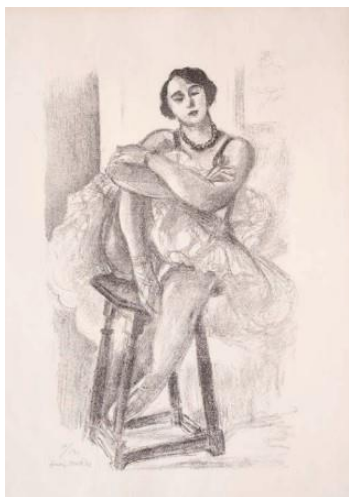
↑ アンリ・マティス「足を組むダンサー」 リトグラフ 46×28cm 2,640,000円(税込)

エコール・ド・パリとは20世紀前半のパリに集った芸術家たちのこと。その個性豊かで自由な表現はその後の芸術家たちに大きな影響を与えた。