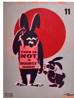
→ NOT BANKSY 「IDENTITY CRISIS CHIMPS IS NOT A BANKSY BUNNY NOR A BOUNCY BANKSY "original"」 multi-colour screen printpainting on plywood 80×60.5cm 880,000円(税込)