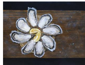
名和智明「牡蠣」 10号 660,000円(税込)

多彩な才能を輩出する東京藝術大学出身の若手日本画家たちの特集。瑞々しい感性で描かれた作品を1階にて大きく展開します。