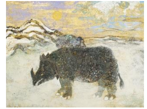
石原孟「犀山水」 10号 440,000円(税込)