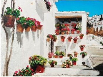
↑ 島津豪亮 「郊外の白い建物」 10号 660,000円(税込)