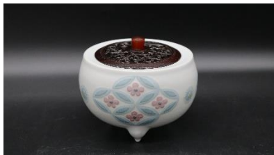
宮之原謙 「彩盛松竹梅文香爐」 共箱 高さ 10.8×径 13.2cm 2,200,000円(税込)