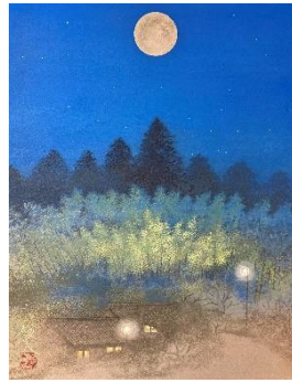
↑ 田淵俊夫「月明かり」 6号 6,600,000円(税込)