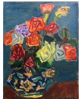
↑ 中川一政「薔薇」 12号 9,240,000円(税込)

◆1階 北ロイベントスペース ◆7階 アートゾーン (美術画廊・アートギャラリー・アートスペース)