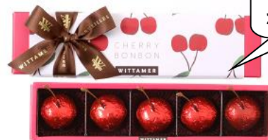
お酒好きなパパに

この時期限定の大人スイーツ！ほろ苦い珈琲寒天のあんみつです。〈船橋屋〉珈琲あんみつ630円