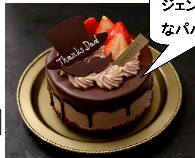
ジェントルマンなパパに

なめらかな口どけのチョコレートのネクタイケーキ！香り豊かなベルギー産クーベルチュールチョコレートのクリームとソフトなチョコスポンジを重ねました。〈アンテノール〉父の日 ベルギーショコラケーキ 1,728円※6/16～6/18