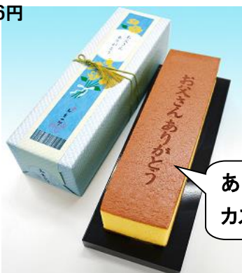
ありがとうカステラ

ジェントルマンなパパへ直径12cmのチョコケーキ！北海道産生クリームをブレンドしたチョコ生クリームと甘酸っぱい苺をしっかりと柔らかなチョコスポンジでサンドしました。〈アンテノール〉パパ・ジェントルマン 3,024円※6/16～6/18