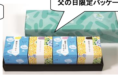
父の日限定パッケージ

たっぷりりんごにラムレーズンとシナモンをたっぷり加えた大人のアップルパイ！〈マミーズ・アン・スリール〉大人のアップルパイ中ホール(1台)1,800円