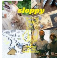
スロッピー Sloppy (アクセサリー)