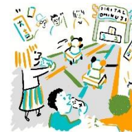
廻るデザイン研究部 × VIVIWARE (デジタルワークショップ)