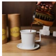
モーク チョコレート Mörk Chocolate (ホットチョコレート)