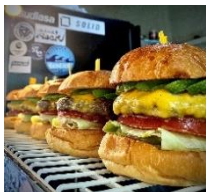
ヤスダ バーガー YASUDA BURGER (ハンバーガー)