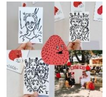
イチゴイチエ 莓一絵 (似顔絵)