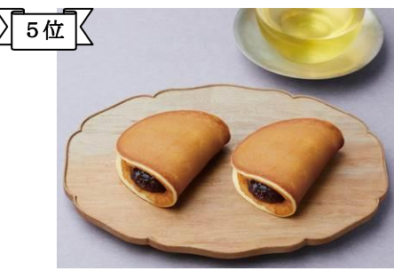
5位 〈京菓匠 鶴屋吉信〉つばらつばら194円 もっちり、しっとりとした食感。つばらつばらとは「しみじみ」との意。(約1万3千個販売)/1階