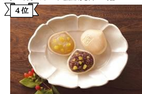
4位 〈銀座あけぼの〉姫栗もなか(1個)162円 刻み栗と炊き合わせたあんがとろける食べやすいもなかです。小倉あん和白あんの二種。(約1万7千個販売)/1階