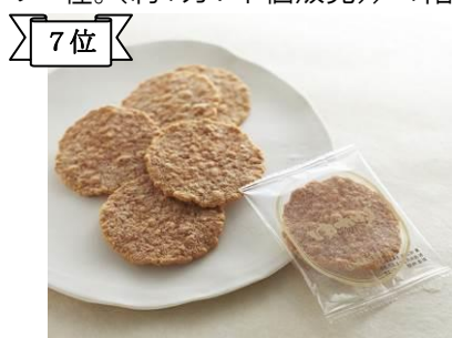
7位 〈坂角総本舗〉ゆかり(8枚)691円 新鮮な海老の身を焼き上げた香ばしい味わい。(約1万個販売)/1階