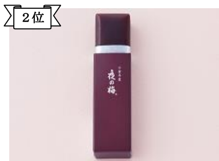
2位 〈とらや〉小形羊羹 夜の梅291円 とらやの代表銘菓「夜の梅」の小形版。(約5万個販売)/1階