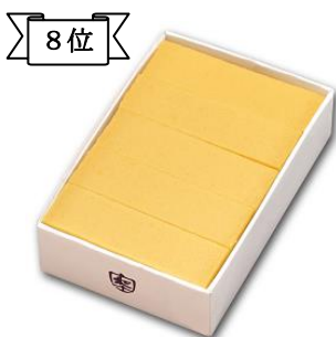
8位 〈舟和〉芋ようかん(5本詰)648円 芋本来の味が楽しめるようかん(約9千個販売)/1階