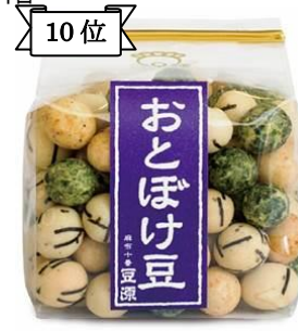
10位 〈豆源〉おとぼけ豆324円 「青海苔」「きざみ海苔」「海老」3種がはいった磯風味。(約7千5百個販売)/1階