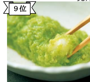
9位 〈ずんだ茶寮〉ずんだ餅(5個入り)865円 「ミヤコガネ」をもち米からついた餅と枝豆の香り高い風味がマッチ。(約8千個販売)/1階