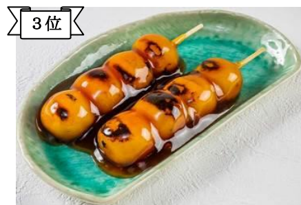
3位 〈深川伊勢屋〉焼きだんご(1本)130円 上新粉本来の旨み甘みを最大限に引き出した創業より伝わる味。(約3万7千本販売)/地階