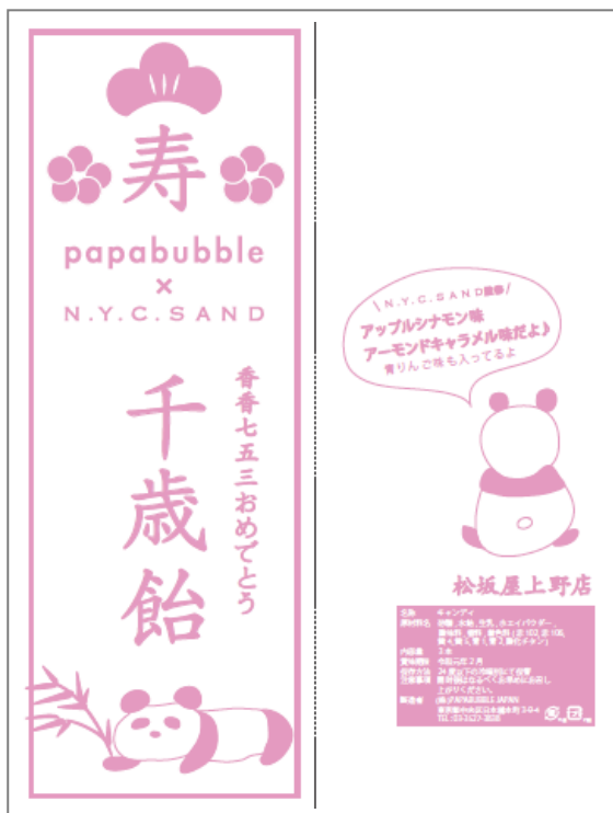
(千歳飴袋イメージ)

シャンシャンの七五三をきっかけに、実演パフォーマンスで有名なバルセロナ発のキャンディショップ〈パパブブレ〉と、東京駅を中心に行列の絶えない大人気スイーツショップ〈N.Y.C.SAND〉が初タッグ！！スペシャルな限定千歳飴が完成しました！！