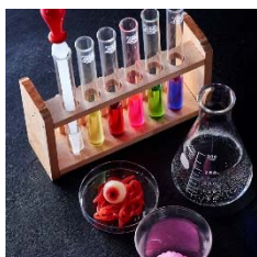
オリジナルカクテル ¥590～