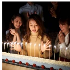
記念日ロングケーキイメージ 罪深き俺たちのコース ¥3800