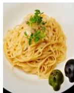
ジキルとハイドの