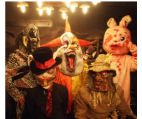
モンスターがサプライズ

そのこだわりは入店時から始まり、光と音の交差する迷路のようなエントランスを抜けた先で、待ち構えていたポリスに手錠を掛けられます。連行されたのは、鉄格子に囲まれた薄暗い監獄個室。この牢獄でお客様には「囚人」として晚餐をして頂きます。灰と黒のボーダーの制服に身を包んだ模範囚（ホールスタッフ）の運んでくるビーカーやフラスコ・メスシリンダーに注がれた毒々しい「オリジナル実験カクテル」や、味でもヴィジュアルでもネーミングでも楽しめる「オリジナル演出料理」、記念日には骸骨や十字架を模したケーキにお名前とメッセージを入れてモンスターがお祝いにお邪魔します。