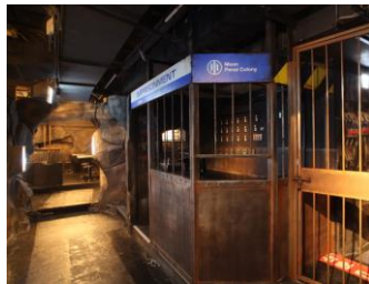
薄暗い地下牢の雰囲気演出