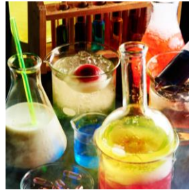
ビーカーやフラスコのカクテル