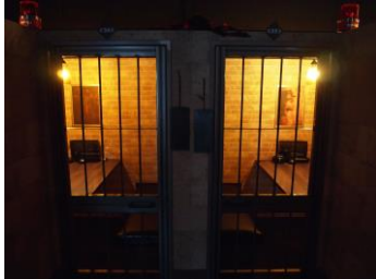
鉄格子で仕切られた監獄風個室

監獄レストラン「ザ・ロックアップ」は9月現在、東京を中心に関東5店舗、関西3店舗、新規出店の静岡店・宇都宮店を加え、計10店舗を展開しています。 「監獄」をテーマにしたコンセプトレストランとして20代～30代の男女をターゲットに、他では類を見ないエンターテイメント性で一瞬にして暗黒の牢獄世界に惹き込みます。