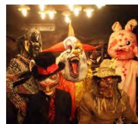
突如メンスターが暴れ出す アトラクションは1日数回

【ザ・ロックアップ】は、他にないエンターテインメント性に突起した監獄がテーマのコンセプトレストランです。20代～30代 男女のデート、合コン、女子会、記念日需要の目的客をターゲットに置き、今年度からは今後の出店計画に【人口40万人都市に監獄レストランを1店舗、全国50店舗】を「全国監獄化計画」と称し掲げております。