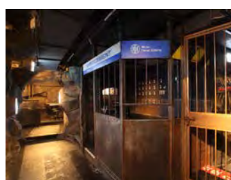
薄暗い地下牢の雰囲気演出