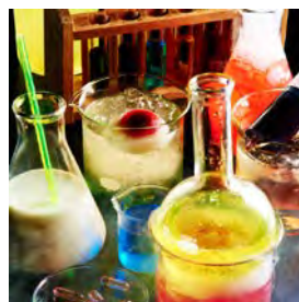
ビーカーやフラスコで楽しむ オリジナルカクテル