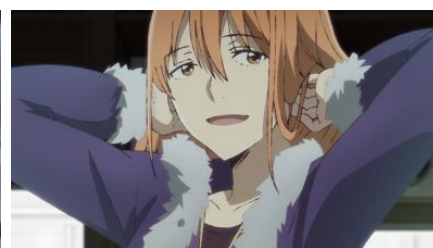
柚原チカ：喜多村英梨