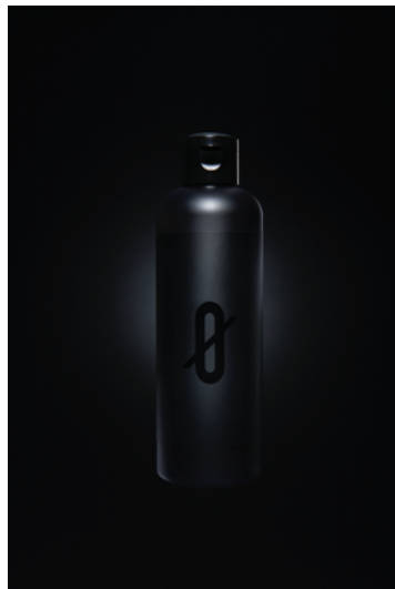
SKIN X ザ・スカルプシャンプー（仮）

「SKIN X ザ・スカルプシャンプー（仮）」は、多くの成人男性が悩むフケ・かゆみの対策として、古来から抗菌作用をもつ樹木と名高いヒノキから抽出した成分「ヒノキチオール」をメイン成分としたリンスインシャンプーです。500本限定でご購入者さまのフィードバックをAmazonレビュー記入のかたちで収集し、その内容をもとに製品をアップデートした後、今秋頃に本ローンチ予定となっております。そして、今回フィードバックをいただけるご購入者さまをSKIN X 製品の共創アンバサダーとしてお迎えすべく、応募STEPやSNS投稿にあたっての「失敗あるある」を公開いたします。