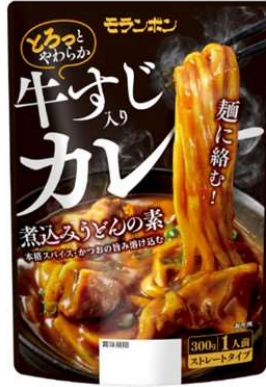
牛すじ入りカレー煮込みうどんの素