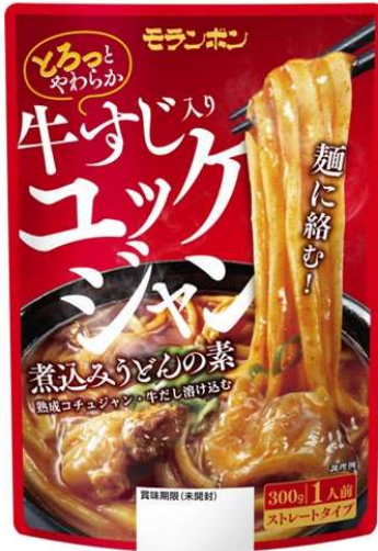
牛すじ入りユッケジャン煮込みうどんの素