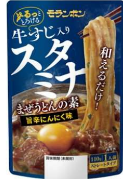
牛すじ入りスタミナまぜうどんの素