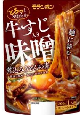
牛すじ入り味噌煮込みうどんの素