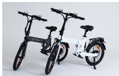
ATOM Full eBike