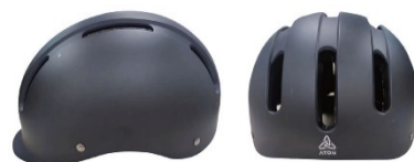
ヘルメット着用促進キャンペーンとして、 先着1,000台の購入者に ヘルメットを無償提供