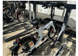
コンパクトに折りたたみ 室内置きも可能