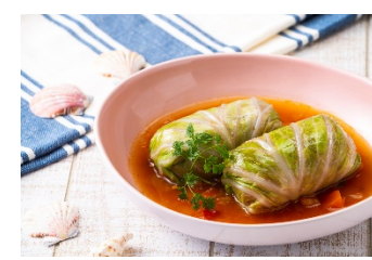
ポークミートロールキャベツ