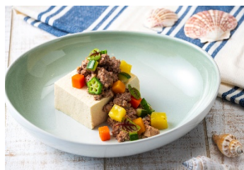
ターキーミートと野菜 本部町山城 のっけ豆腐