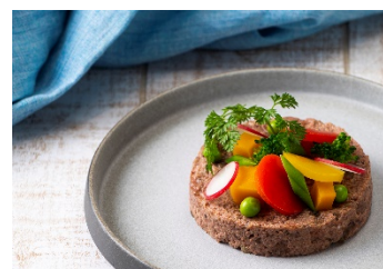
仔牛とパースニップのリエット