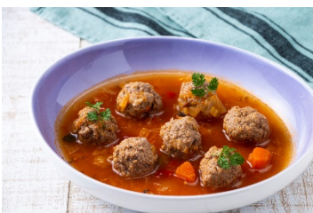
ビーフミートボール入りミネストローネ