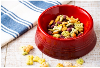
わんわんクッキー