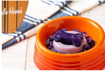
紫芋パンナコッタ