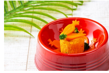
キャロットケーキ