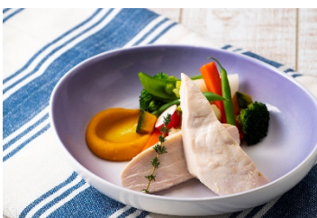
やんばるチキン胸肉のロースト