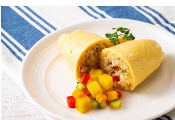
チキンオムライス