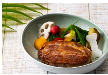
あぐー豚ロース肉のロースト