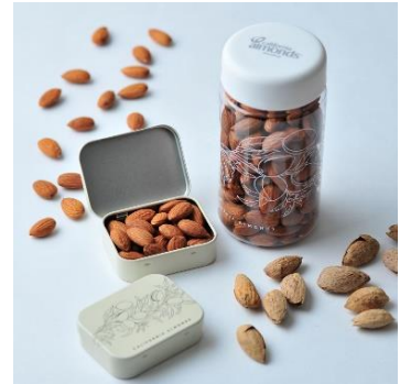
「オリジナル調理ボトル」と「オリジナルアーモンドケース」

当選発表： ご当選された方には、Instagramのダイレクトメッセージにてご連絡いたします。