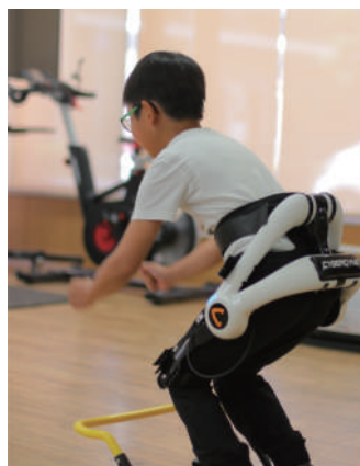
装着型サイボーグ HAL®