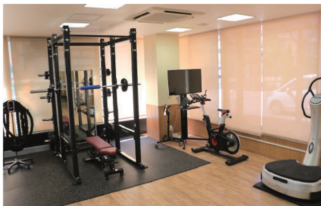
セミパーソナルジム