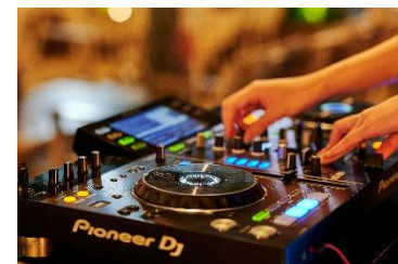
DJによるライブミュージック(土日祝日限定)