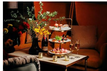
『NYトワイライトハイティー』(イメージ)

https://www.strings-group.jp/omotesando/restaurant/zelkova/info/zelkova-hightea.html