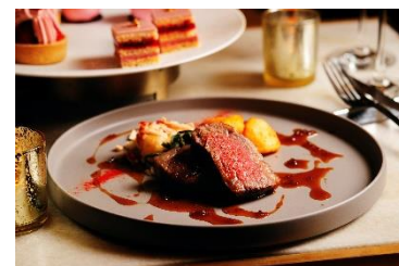
選べるメインディッシュ(イメージ)