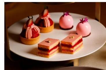
季節のスイーツ(イメージ)