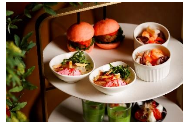
季節のセイボリー(イメージ)