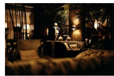
ラグジュアリーなインテリアを配した 店内(イメージ)