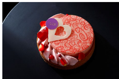
ゴージャスバレンタインコースのお土産 「マイバレンタイン」