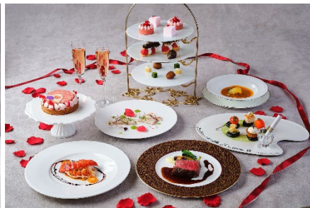
ファインダイニングラ・プロヴァンスの ゴージャスバレンタインコース