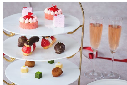
アフタヌーンティースタイルのデザート (イメージ)