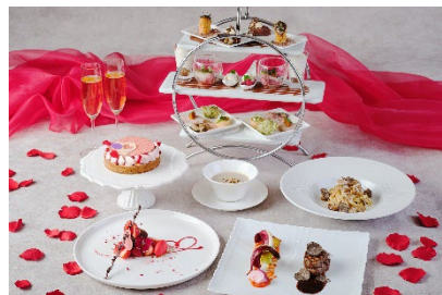
ジリオンのゴージャスバレンタインコース