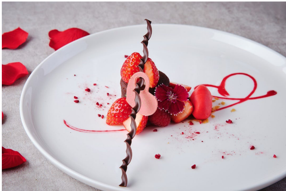
イタリアンダイニング ジリオンのバレンタイン限定ショコラデザート(イメージ)

販売期間：2025年2月1日(土)～2月14日(金)／場所：ラ・プロヴァンス、ジリオン