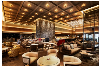
ハドソンラウンジ 内観

2020年6月27日グランドオープン「逢う・集う・囲む」をコンセプトにした開放的かつダイナミックなラウンジ&バー。天井高5mの「火を囲む暖炉のあるラウンジ」を空間の中心とし、7mのカウンターを備え、光と影が演出するアーティスティックで魅惑的なバーエリア「アンバー」と、ソファ席や洛中洛外図を設置したラウンジエリア、ライブラリーの落ち着いた雰囲気を出すエリア「ザ ライブラリー」、会食や接待、ミーティングにもご利用いただけるプライベートルーム「ライト」「エジソン」を完備した、人と人の交わる、当ホテルの新たなシンボルラウンジです。