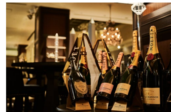
モエ・エ・シャンドンやドン・ペリニオンもご用意

https://www.interconti-tokyo.com/newyorklounge/