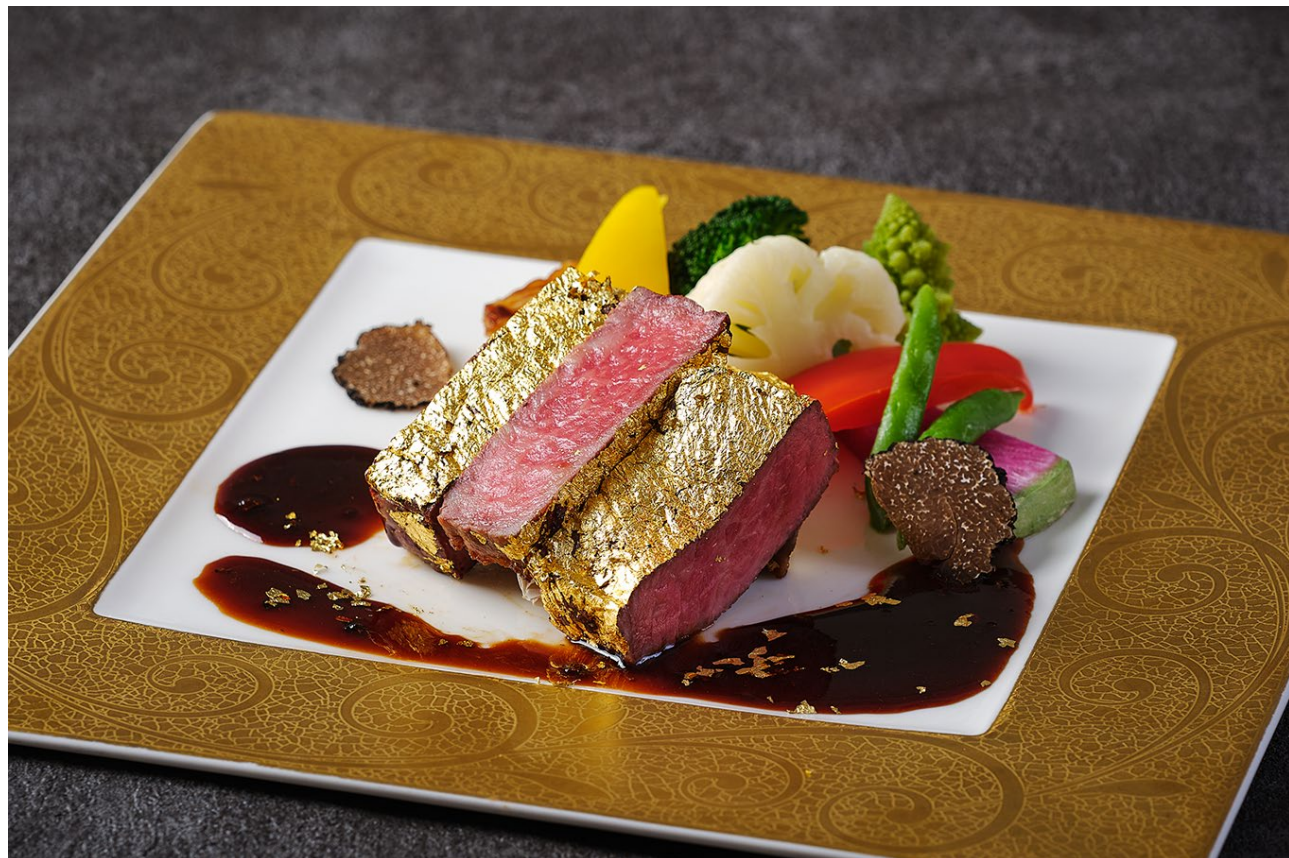
キラキラと輝くゴールドが目を惹く金箔を纏ったステーキ

販売期間: 2025年1月1日～1月31日 場所: ハドソンラウンジ、ニューヨークラウンジ