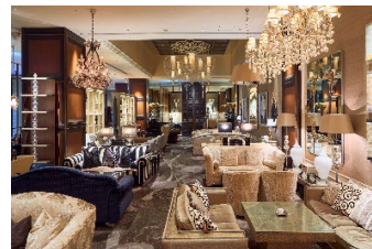
ニューヨークラウンジ 内観

上質なインテリアの中にゆったりとお掛けいただけるソファ席を配した華やかな店内では、見た目にも鮮やかな美食を提供します。一角に設けられたデザート工房「アトリエ・デセール」で仕上げられるアフタヌーンティーやパフェ、パンケーキなどのスイーツの他、サンドイッチやハンバーガー、各種御膳など、軽食からしっかりしたお食事までさまざまな用途に対応できるバラエティ豊かなメニューをご用意しております。各種アルコールも取り揃えておりますので、夜はバーラウンジとしてもお楽しみいただけます。