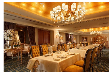
ホテルとともに30周年を迎えるラ・プロヴァンス

シェフが目の前で調理する、オールデイダイニング「シェフズライブキッチン」をはじめ、ニューヨークスタイルの新感覚イタリアン、伝統的な南フランス料理を現代風にアレンジしたモダンフレンチ、匠の技と厳選食材を提供する鉄板焼など、世界の味覚を網羅した7つのレストラン、ラウンジ&バーをご用意しています。また、レインボーブリッジやリトルマンハッタンと称される隅田川の夜景を臨むルーフトップバーも併設し、お客様のご利用目的、シチュエーションにあわせてお選びいただけます。