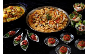
海外インターコンチネンタルホテルのシグネチャーディッシュも楽しめる