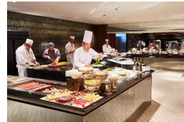
シェフズライブキッチン内観

「一品ひと品がスペシャルティ」、「シェフの心が息づく躍動感あふれる海辺のオールデイダイニング」がコンセプトのシェフズライブキッチンは、「ヘルシー・ビューティー・フレッシュ」をテーマにした美味しいメニューを心ゆくまでお楽しみいただけ、元気で美しくなれるようなシェフの心遣いを感じていただけるレストランです。こだわっているのは「出来立ての美味しさ」と「心に残る楽しい時間」を提供すること。常に新しいシーンをご提案できるよう、美味しさと楽しさを追求し続けています。