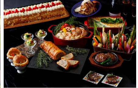
ホテル内各レストランの味がbuffetで楽しめる