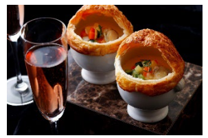
クラムチャウダー風パイ包み焼きスープをお席までお届け