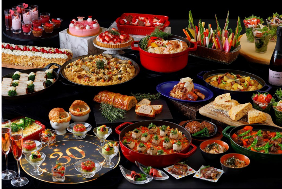
ホテル開業30周年イヤーの幕開けを華やかに演出するスペシャルbuffet