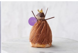
ピースサイズのプレミアムモンブラン