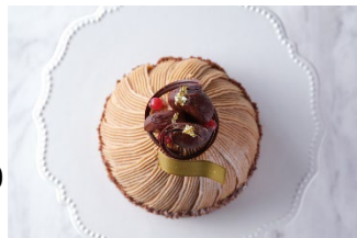
スタイリッシュな美しいフォルム

https://www.interconti-tokyo.com/boutique/cake.html