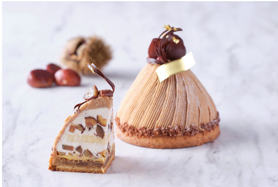
栗好きのための和栗尽くしの逸品、ホールサイズの「スーパープレミアムモンブラン」が登場。

販売期間：2024年9月1日(日)～通年販売 場所：ザ・ショップ N.Y.ラウンジブティック