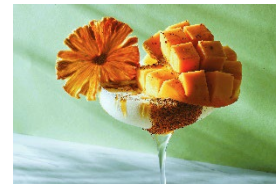
サン ウィズ サンフラワー

https://www.interconti-tokyo.com/hudsonlounge/plan/hdl-mango-cocktail.html