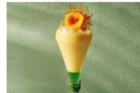
マンゴーグリーンフラッシュ