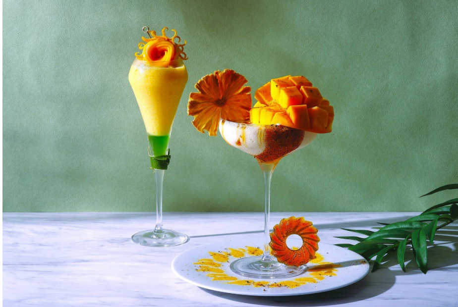
「メキシコの太陽」をイメージし、フレッシュマンゴーを贅沢にアレンジしたカクテル(右) & モクテル(左)

販売期間: 2024年7月1日(月)~8月31日(土)まで 場所: ハドソンラウンジ