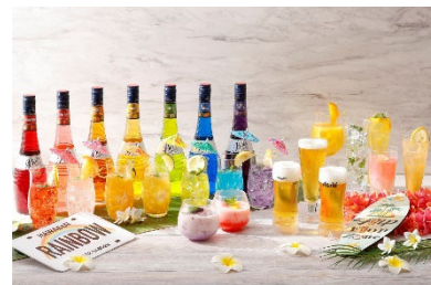
7色のレインボーカクテルをご用意