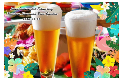
「palanAR(パラナル)」を使ったフォトフレーム(イメージ)