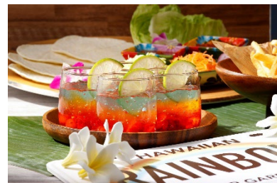
デザートはさっぱりとした味わいのレインボーゼリー