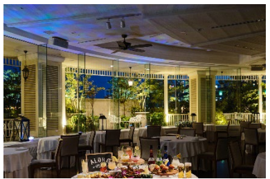
会場 ハーバービューテラス