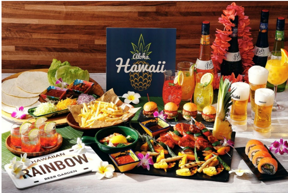
ハワイアンフードやグリル料理とともに7色のレインボーカクテルやビールなど、70種類以上のドリンクをフリーフローでお楽しみいただけるレインボーハワイアンビアガーデン

期間: 2024年7月11日(木)~9月20日(金) 場所: ハーバービューテラス