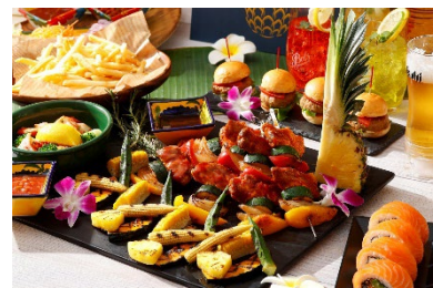
ビールと相性のよいポークブロシェットとグリル野菜