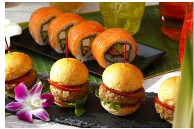
本格的な味わいのミニバーガーと寿司ロール