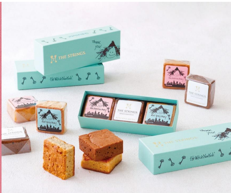
Fat Witch New York × ザ スtrings 表参道 オリジナルパッケージギフトが登場

NYで大人気の魔女のキャラクターが可愛い濃厚チョコブラウニー専門店「Fat Witch New York(ファットウィッチニューヨーク)」とコラボレーションした、ザ スtrings 表参道オリジナルギフトが新登場。表参道のケヤキ並木の緑をイメージしたカラーに、Stringsのロゴである鍵をモチーフにしたマークを散りばめた愛らしいパッケージに人気の3種類のフレーバーを詰めてお届けいたします。バレンタインに愛を贈りたい方へのギフトや、感謝の気持ちを込めた手土産にいかがでしょうか。