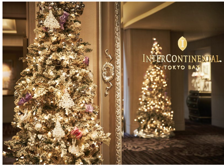
ホテル館内がクリスマス仕様になってお客様をお出迎え