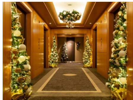
華やかな「クリスマスフロア」が登場