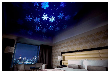
スノーホワイトルームには幻想的な雪の結晶が投影される(イメージ)

(左) 厳選した食材を使った豪華なスペシャルディナーコースをご提供、(右) デラックスブレックファスト(イメージ)