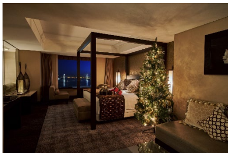
デザイナーズスイート&ルームは4タイプを揃え、クリスマスツリーが飾られる(写真はラグジュアリーオリエンタル)