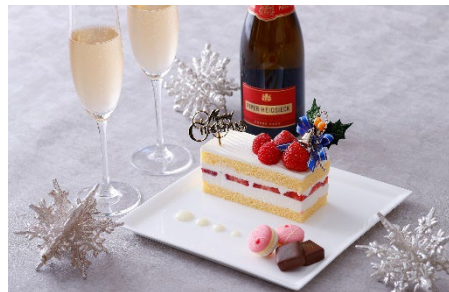
クリスマスケーキとスパークリングワイン(イメージ)