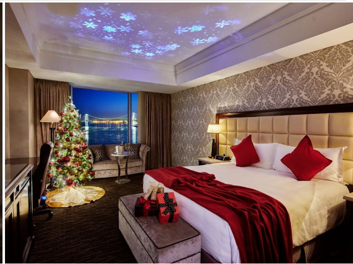
聖なる夜をロマンティックに彩るクリスマスステイプランを用意

ホテル インターコンチネンタル 東京ベイ(所在地: 東京都港区海岸 1丁目16番2号、総支配人: 宮田 宏之)では、12月1日~12月25日まで、期間限定でクリスマスのデコレーションが施された「クリスマスフロア」が登場し、東京湾のロマンティックな夜景をお楽しみいただきながら大切な方と思い出に残る特別な夜をお過ごしいただける多彩な「クリスマスステイプラン」をご用意いたしました。