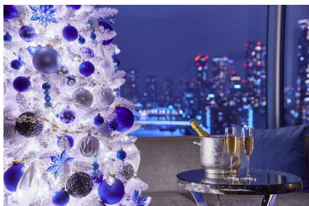
ロマンティックな夜景を楽しみながらお二人だけの時間を過ごせる