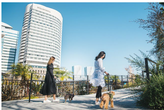
竹芝栈橋ではリードをつけて愛犬との散歩ができる