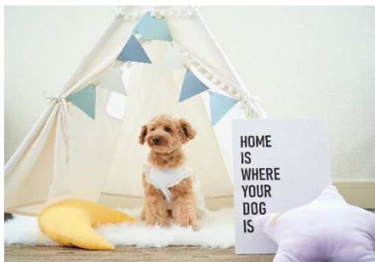
ドッグフレンドリーフロアには専用のラウンジがあり、愛犬とご一緒に寛げるコミュニケーションの場所として利用できる