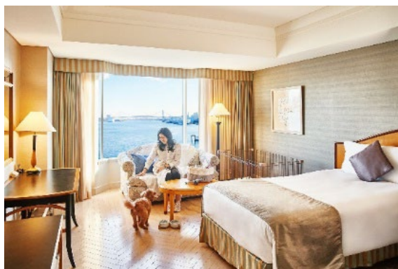
ドッグフレンドリールーム(イメージ)