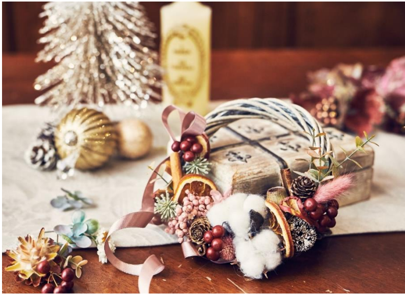
▲クリスマスリースやアンティーク小物(イメージ)

ザ スtrings 表参道(所在地: 東京都港区北青山3-6-8、総支配人: 山田弘之)では、 1階「Cafe & Dining ZelkovA(カフェ&ダイニング ゼルコヴァ)」のテラスエリアにて、SDGsの取り組みの一環として ウェディングの装花をアップサイクルしたドライフラワーや、アンティーク小物、ウェディングドレス生地を使用した 愛犬用ドレスなどを販売する『ストリングス クリスマス マルシェ』を、2022年12月20日(火)の1日限定で開催いたします。