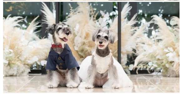
▲(上)2022年4月に開催した「ストリングス 花マルシェ」の様子 (下)オーダーメイドの愛犬用ドレス・タキシード(イメージ)

今年4月に開催し大変ご好評いただきました『ストリングス 花マルシェ～Sustainable Flowers～』の第二弾として、 ホリデーシーズンにあわせた『ストリングス クリスマス マルシェ』を開催いたします。