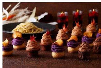
紅葉をのせて秋の装いに

<セイボリー> ※ニューヨーククラウンジ、ハドソンクラウンジで提供 かぼちゃのポタージュ、栗とベーコンのキッシュ、照り焼きチキンとキノコのトルティーヤロール、 サツマイモとクリームチーズのディップ、スモークサーモンのタルタル ミニパンケーキ