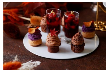
4種のモンブランの食べ比べを楽しめる