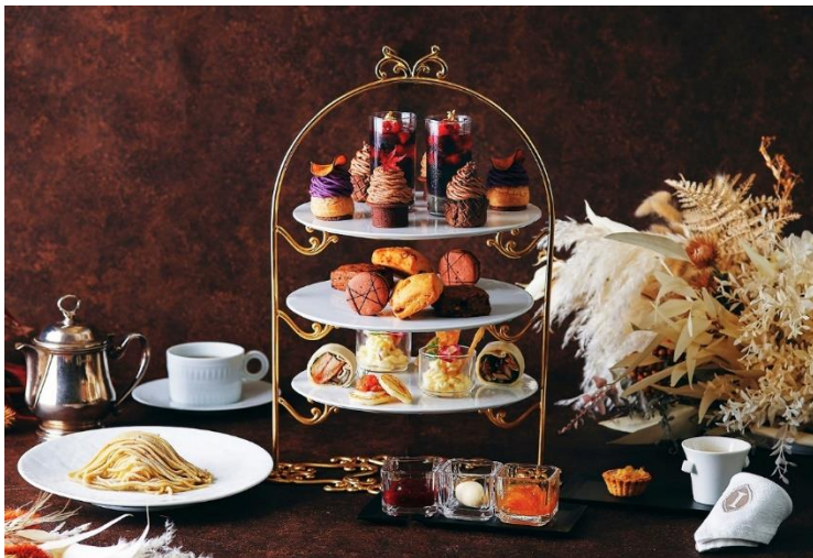
4種のモンブランをラインナップしたアフタヌーンティー(ニューヨーククラウンジイメージ)

販売期間：2022年11月1日(火)～2022年11月30日(水)／場所：ニューヨーククラウンジ、他4店舗、インルームダイニング