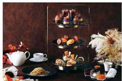
ハドソンラウンジのアフタヌーンティー(イメージ)

【内容】プティ・ガトー6種、スコーン2種、セイボリー5種、コーヒー、紅茶・ハーブティーなど(6種)