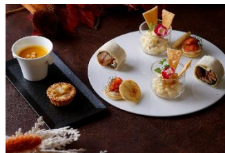
かぼちゃや栗など秋の味覚を使ったセイボリー

[添付資料] 店舗別アフタヌーンティーの内容、新型コロナウイルス感染症への当ホテルの取り組みについて、インターコンチネンタルホテルズ & リゾーツについて