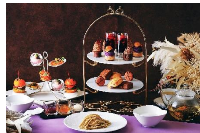
マンハッタンのアフタヌーンティー(イメージ)