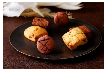
スコーン2種とチョコレートマカロン