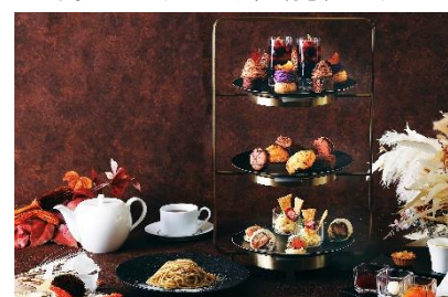
インルームダイニングのアフタヌーンティーイメージ