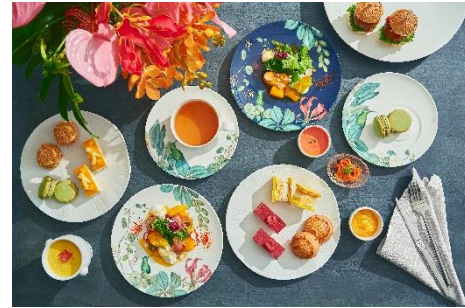
南国を彷彿とさせるスイーツとお皿

www.strings-hotel.jp/omotesando/information.html#counterplan