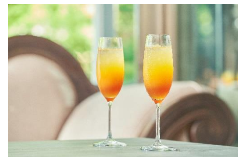
オリジナルカクテル「ティーミモザ カラバッジョ」