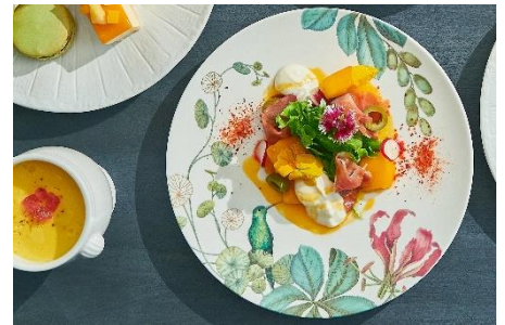
マンゴーと生ハムのサラダ～Presents from Paradise～