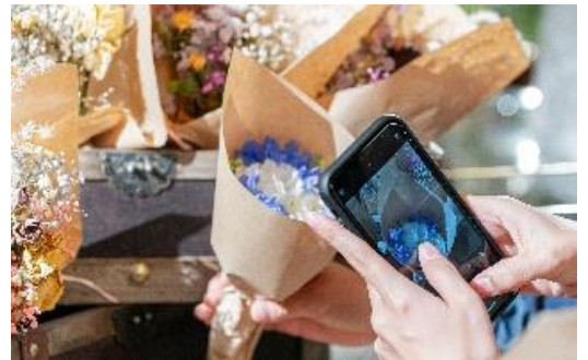
▲(上)施設専属のフローリストが花選びをお手伝い (下)ドライフラワーイメージ

ウェディング会場を鮮やかに彩る装花は、施設専属のフローリストが温度管理などを細かく調整し、披露宴当日に最高の状態を迎える一級品。その美しさはドライフラワーにしても衰えません。