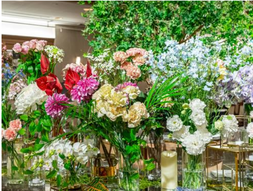
▲生花イメージ。春らしい花を多数ご用意。

ザ スtrings 表参道(所在地:東京都港区北青山3-6-8、総支配人:山田弘之)では、1階「Cafe & Dining ZelkovA(カフェ&ダイニング ゼルコヴァ)」のテラスエリアにて、SDGsの取り組みの一環としてウェディングの装花をアップサイクルしたドライフラワーや、廃棄予定の花“ロスフラワー”を販売するイベント『STRINGS 花マルシェ～Sustainable Flowers～』を、2022年4月1日(金)・2日(土)の2日間限定で開催いたします。