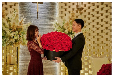
「100%の愛」の意味が込められた「ワンハンドレッドローズ（バラ100本）」をご用意