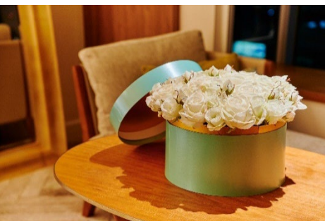
「不変の愛を誓う」という意味を持つバラ44本のフラワーBOX（イメージ）