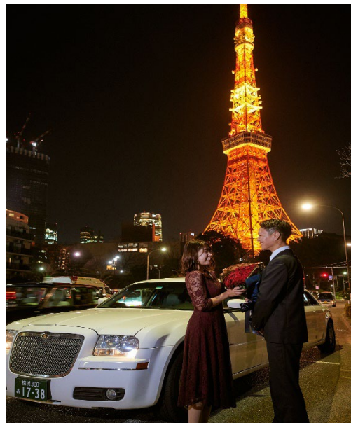
東京タワーを背景に豪華なリムジンで映画のワンシーンのようなプロポーズ

ホテル インターコンチネンタル 東京ベイ(所在地:東京都港区海岸 1丁目16番2号、総支配人:山田 弘之)では、年に100件以上のプロポーズを成功させた実績と、数々の感動をお届けしてきたプロデュース力を最大限活かし、様々なサプライズ演出を取り入れた、ワンランク上のドラマティックなプロポーズができる新たなプランと演出が登場いたしました。