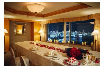
絶景の夜景を眺めながら個室で二人きりの時間を ゆっくり過ごせる