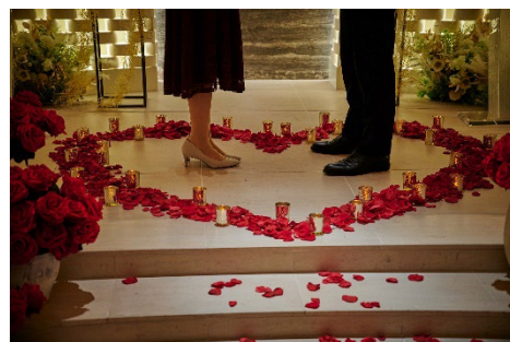
花びらで描かれたハートとキャンドルで特別感を演出