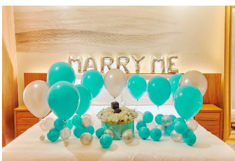
特別な日を彩るカラフルなバルーンをアレンジ