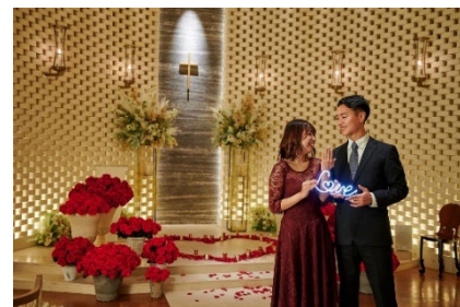
チャペルを貸切ってドラマティックな空間でプロポーズ

内容：料理、シャンパン HALF ボトル、プロポーズ用フラワーBOX または 生花束）、 アニバーサリーケーキ