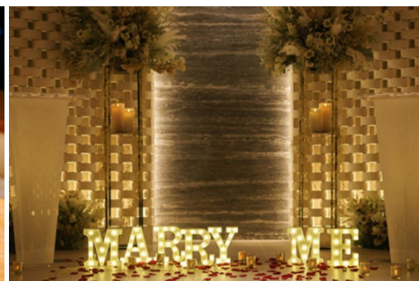
サプライズ演出のアイテム数々で映画のようなシーンをお届け