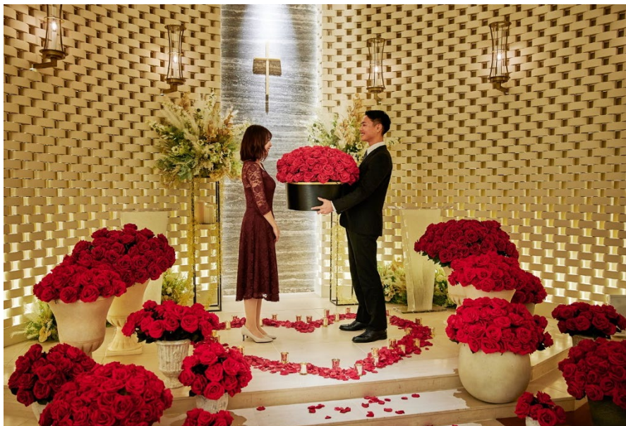
「一万年の愛を誓います」という意味を持つ「サウザンド・ローズ(1000本のバラ)に囲まれたチャペルで感動的なプロポーズを演出