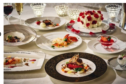
華やかなサプライズケーキ付ディナー(イメージ)

内容：料理、乾杯酒、スイートルームでのご宿泊、100本のバラの花束、アニバーサリーフォト、 チャペルまたはベイサイドテラスでのプロポーズ、プロポーズ祝福演出(花びら、 HALF シャンパンボトル)、フラワーバス