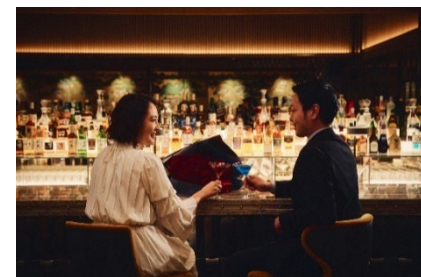
ハドソンラウンジのBAR「アンバー」で大人の プロポーズを演出(イメージ)

内容：料理、シャンパン HALF ボトル、プロポーズ用フラワーBOX、ハドソンラウンジでのカクテル