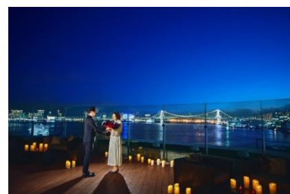
夜景が広がるベイサイドテラスで、よりロマン チックな雰囲気の中でプロポーズ

内容：料理、シャンパン HALF ボトル、ジュニアスイートルームでのご宿泊、プロポーズ演出 (花びら、 HALF シャンパンボトル)、プロポーズ用花束