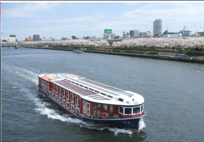
シェフズ ライブ キッチンでのランチアフターで水上バスに乗船して隅田公園の桜を鑑賞