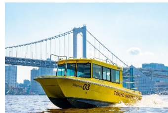
都会の水上散歩が楽しめる東京ウォータータクシー

https://www.interconti-tokyo.com/stay/plan/water-taxi.html