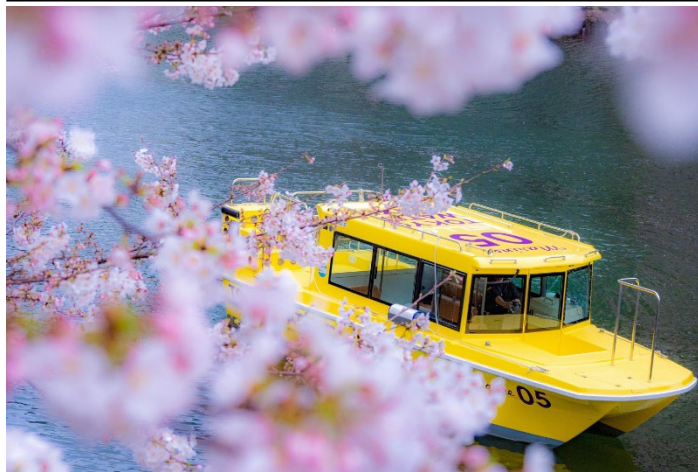
東京ウォータータクシーでのお花見クルーズが付いた宿泊プランを用意

宿泊プラン期間:4月10日(日)まで | ランチプラン販売期間:4月17日(日)まで