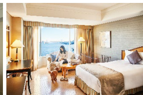
ドッグフレンドリールーム