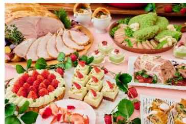
ワールドミート&amp;ストロベリーフェア(イメージ)

https://www.interconti-tokyo.com/restaurant/chefs-live-kitchen/plan/clk-cruise.html