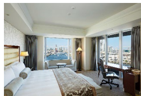
エグゼクティブフロア リバービュー