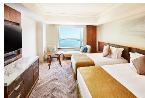
デラックスフロア ベイビュー

クラブフロアにご宿泊のお客様専用のラウンジを20階にご用意しております。チェックイン・アウトのお手続きをはじめ、フリードリンクサービスや朝食、アフタヌーンティー、クラブディナーをお楽しみいただけます。