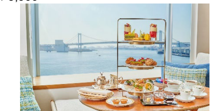
客室でもアフタヌーンティーを提供

本リリースに関するお問い合わせ先 ホテル インターコンチネンタル 東京ベイ 広報担当: 白石、鄭