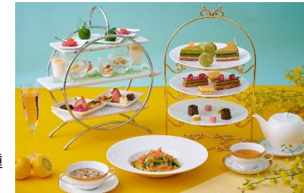
イタリアンダイニング ジリオンで提供するアフタヌーンティー付きランチイメージ

【内容】プティ・ガトー5品(マカロン ユズを提供)、スコーン2種、セイボリー5種、コーヒー、紅茶・ハーブティーなど(6種)