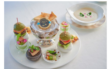
マンハッタンで提供する世界三大珍味が付いたセイボリー

前菜3品、メインディッシュ、アフタヌーンティースタイルデザート ハーブティーまたは コーヒー、紅茶など(10種類)