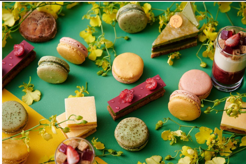
抹茶やゆず、わさびなどの和食材をアレンジし、洋菓子としてのジャポニズムを表現

販売期間：2022年4月1日(金)～5月31日(火) 場所：ニューヨーククラウンジ、他4店舗、インルームダイニング