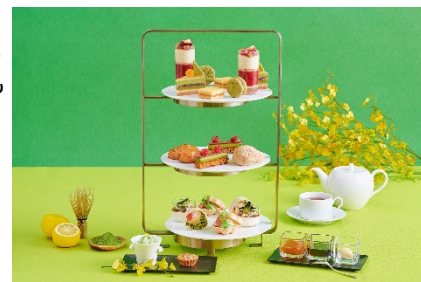
ハドソンラウンジのアフタヌーンティーイメージ

[ドリンク] コーヒー4種、アイスコーヒー、アイスカフェオレ、アイスティー、日本茶2種、クラシックティー2種、ハーブティー2種、フレーバーティー5種、ジュース3種、ノンアルコールスパークリングワイン2種、ノンアルコールワイン2種(計25種)