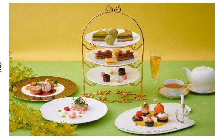
ラ・プロヴァンスで提供するアフタヌーンティー付きランチイメージ

乾杯酒(シャンパン)、ハイティースタイルオードブル、スープ、選べるパスタ、国産牛とフォアグラ ロッシーニ仕立て、アフタヌーンティースタイルデザート、ハーブティーまたは コーヒー、紅茶など(10種類)