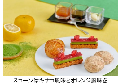
スコーンはキナコ風味とオレンジ風味をラインナップ。ウメのコンフィチュール、黒蜜、クロテッドクリームを用意