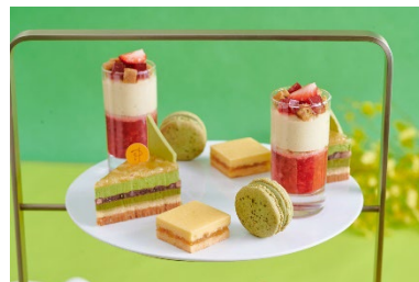
店舗ごとに異なる味わいのマカロンを提供