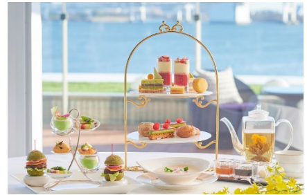
マンハッタンで提供するアフタヌーンティーイメージ

* 上記のセットの他にWEB予約限定で、チーズまたは生ハムプレート付きセット ¥6,870~、セイボリーアップグレード(世界三大珍味付き)プラン ¥8,695~、モクテルフリーフローが付いたプラン ¥6,435~をご用意しております。