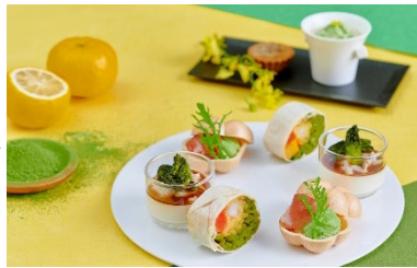
セイボリーは隣接するフレンチレストランより提供

<ピエール・エルメ(Pierre Hermé)> 21世紀のパティスリー界を先導する第一人者。4代続くアルザスのパティシエの家系に生まれ、14歳のときガストン・ルノートルの元で修業を始める。常に創造性あふれる菓子作りに挑戦し続け、独自の“オート・パティスリー”(高級菓子)のノウハウ伝授にも意欲を燃やしている。