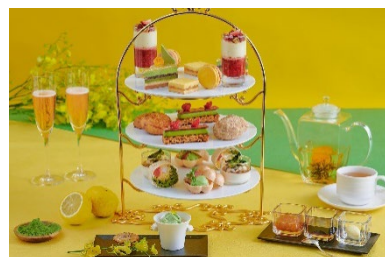
ニューヨークラウンジのアフタヌーンティーイメージ

【ドリンク】 クラシックティー3種、ハーブティー4種、フレーバーティー4種、中国茶3種、日本茶2種、コーヒー4種、アイスコーヒー、アイスカフェオレ、アイスティー、チョコレート(計24種)