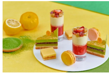
ニューヨークラウンジのスイーツイメージ